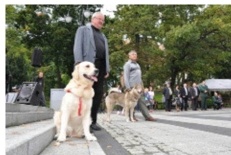
Krzysztof Fidler , pokaz psów rasowych (2012).