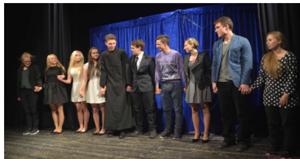
aktorzy spektaklu „Cień”

absolwentka roku 1969 Szkoły Podstawowej w Gąskach.