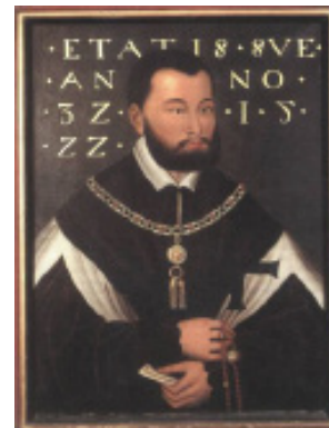
Albrecht I von Hohenzollern, portret pędzla Lucasa Cranacha Starszego